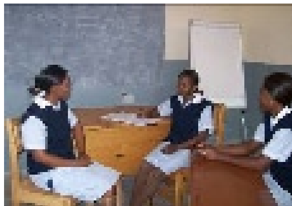
Rollenspel van tweedejaars studenten

Ik heb het hier heel erg naar mijn zin en zie er nu al tegenop om over vier weken weer terug naar Nederland te gaan. Maar goed, ik hoop dat ik dan wel de lessen van Integrated Reproductive Health heb kunnen afronden in beide groepen, evenals de module. Ik doe in ieder geval mijn best. + + +