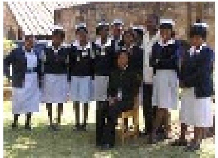
De helft van de studenten van jaar drie, met een hiv/aids-deskundige.

Aan het einde van de cursus ontvingen ze een certificaat van het Zambian National Aids Network .